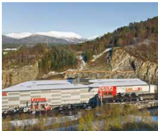
RETAIL SITE, 11 400 KVM I ÅLESUND