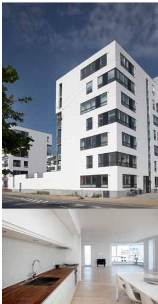
BOLIGER, CA. 4 600 STK SIDEN 2004