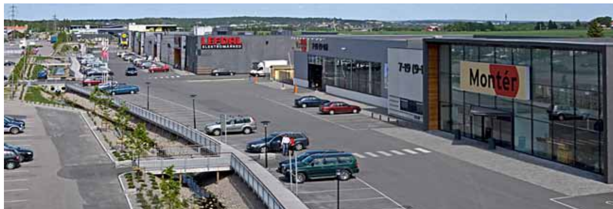
SHOPPING AREA, 17 000 KVM I FREDRIKSTAD